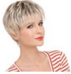
Stop Hi Tec 219€ ** 13 coloris