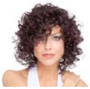
Jamila 219€ *^^^ 10 coloris