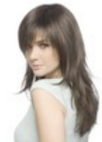
Vogue 239€ ** 7 coloris