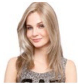
Mega Mono 459€ ****^ 9 coloris