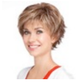
Time Mono 449€ **** 10 coloris