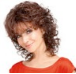
Flaviana 209€ * 7 coloris