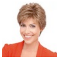
Crystal Deluxe 499€ ***** 7 coloris