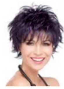
Click 169€ * 12 coloris