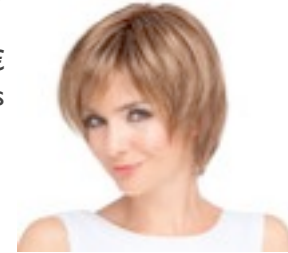
Shine confort 429€ **** 11 coloris