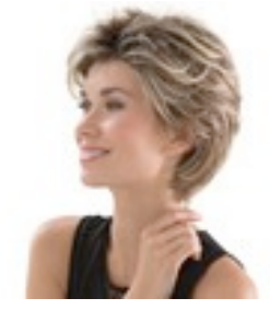
Citta Mono 439€ ****^^^ 13 coloris