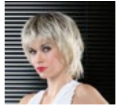
Gemma 449€ ****^ 12 coloris