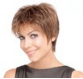
Cinema Deluxe 499€ ***** 15 coloris