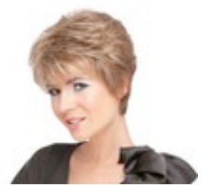
Viva 169€ * 13 coloris Viva 419€ **** 11 coloris