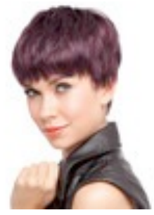
Space 199€ * 14 coloris