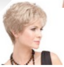
Apart 179€ *^^^ 12 coloris Apart Mono 379€ 13 coloris ****^^^