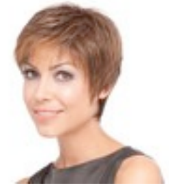
Zizi 199€ * 15 coloris Zizi mono 369 € *** 16 coloris