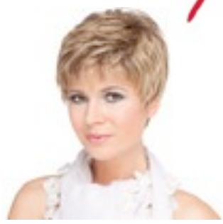
Mia Mono 429€ **** 11 coloris