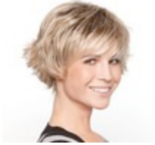
Date 209€ ** 14 coloris