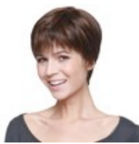
Liza Deluxe 479€ ***** 8 coloris