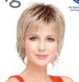
Play 229€ ** 12 coloris