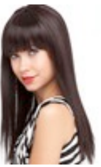
Cher 269€ ** 9 coloris