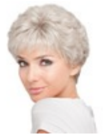
Elenora confort 349€ **** 11 coloris