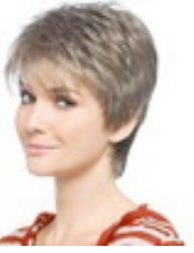
Babs Mono 419€ ***** 12 coloris