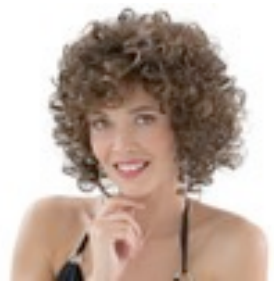
Sunny 219€ *^^ 8 coloris