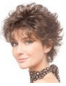
Veronica 169€ * 10 coloris