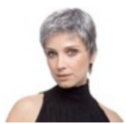
Risk 249€ **** 18 coloris