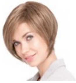
Talia Mono 369€ ****^ 11 coloris