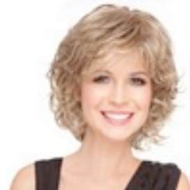
Gina Mono 429€ **** 8 coloris