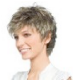
Easy 199€ ** 15 coloris Easy Mono 369€ **** 7 coloris