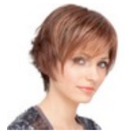
Zara Mono 429€ **** 8 coloris