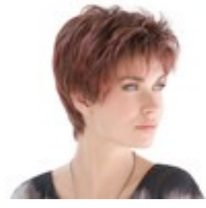
Spring Hi 249€ **^^^ 16 coloris