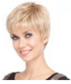
Carol 219€ ** 12 coloris Carol Mono 419€ ****^^^ 12 coloris