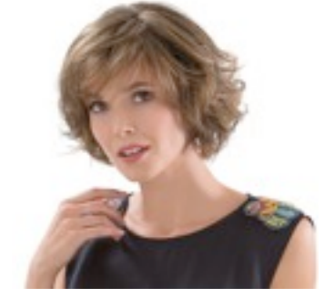
Flair Mono 419€ ***^^ 13 coloris