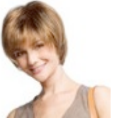
Nova 209€ ** 9 coloris Nova Mono 439€ **** 11 coloris