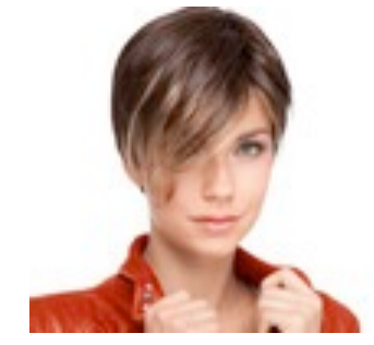
Disc 229€ *** 15 coloris