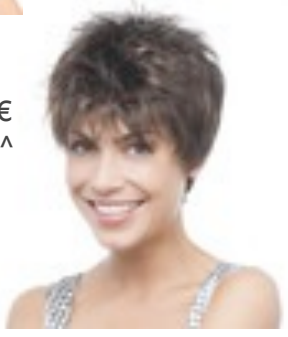
Go Lace 219€ *^^^ 10 coloris