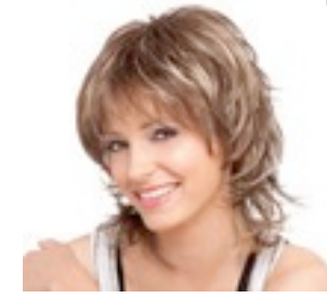
Planet 199€ ** 11 coloris