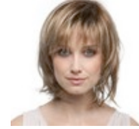
Limit 269€ ** 12 coloris