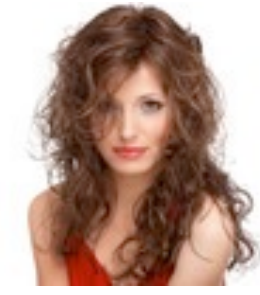
Lola more 289€ *** 6 coloris