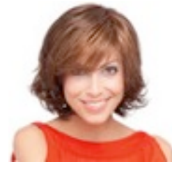
Grace 319€ *** 10 coloris