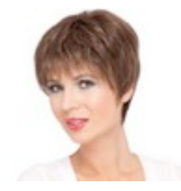
Ginger 249€ *^^^ 12 coloris Ginger Mono 409€ ****^^^ 14 coloris