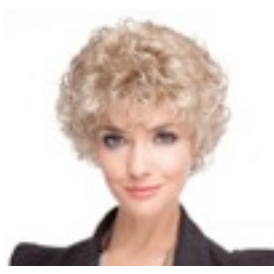
Avanti 179€ * 11 coloris