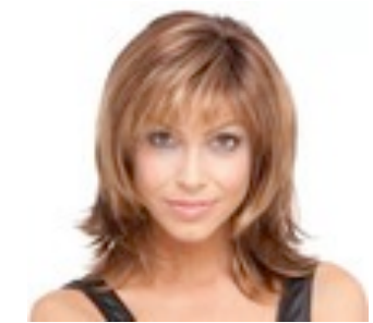
Casino More 269€ ***^^ 8 coloris