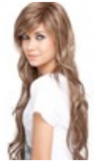
Naomi 249€ ** 6 coloris