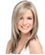
Code Mono 339€ ****^ 9 coloris