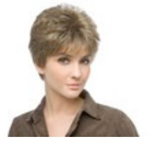
Viva 169€ * 13 coloris Viva Mono 419€ **** 11 coloris