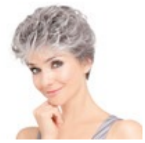
Noelle Mono 429€ **** 12 coloris