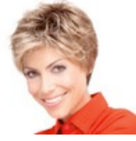
Alba Confort 369€ ****^^^ 9 coloris