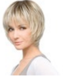
Fashion Deluxe 499€ ***** 16 coloris