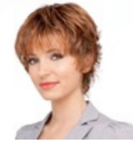
Club 219€ ** 11 coloris