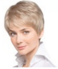
Cara Deluxe 469€ ***** 13 coloris existe en petite