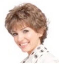
Nancy 179€ * 11 coloris