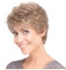
Solitar Mono 389€ **** 11 coloris