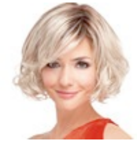
Estelle 269€ *** 8 coloris