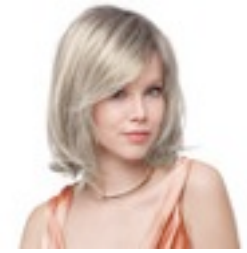
Lucky 299€ ** 11 coloris