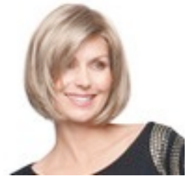
Tempo Deluxe 489€ *****^ 13 coloris