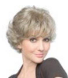
Aurora Confort 369€ ***** 13 coloris