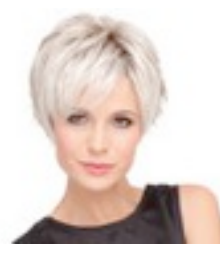
Flip Mono 429€ **** 13 coloris