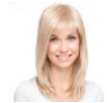
Miley Mono 339€ **** 7 coloris