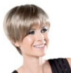
Seven super 279€ ** 10 coloris