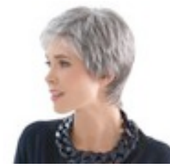
Risk confort 389€ **** 12 coloris