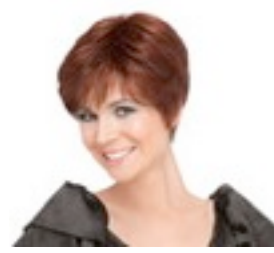
Gold 219€ ** 12 coloris