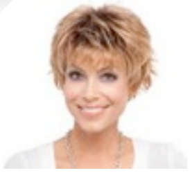
Push up 189€ * 13 coloris