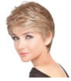
Spring 159€ * 14 coloris Spring Mono 419€ ****^^^ 15 coloris