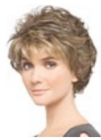
Alexis 209€ ** 8 coloris Alexis Deluxe 499€ ***** 8 coloris