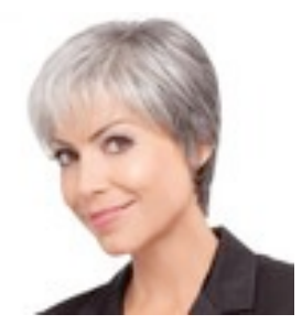
Light Mono 369€ **** 15 coloris