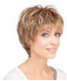
Keira 209€ ** 11 coloris