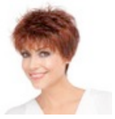
Golf 189€ * 16 coloris Golf Mono 399€ ***** 12 coloris