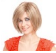
Smoke 239€ ** 12 coloris Smoke Mono 449€ **** 12 coloris Smoke Deluxe 519€ *****^ 10 coloris