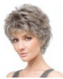
City 169€ * 12 coloris City Mono 399€ **** 10 coloris