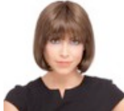
Sue Mono 349€ **** 12 coloris