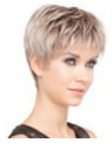
Bo Mono 449€ ****^^^ 10 coloris