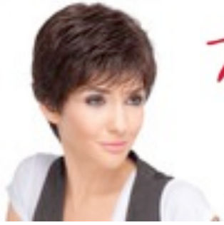
Take 199€ ** 12 coloris