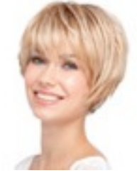
Sky 229€ ** 9 coloris