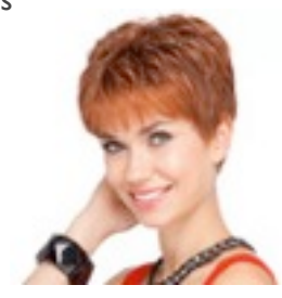
Chip 239€ ** 13 coloris Chip Mono 399€ *** 13 coloris