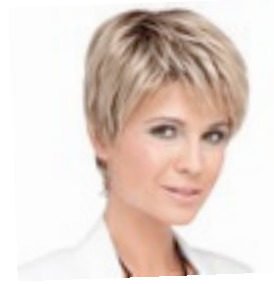
Fair 239€ * 12 coloris Fair Mono 429€ ****^^^ 13 coloris