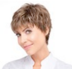
Fox 229€ ** 11 coloris