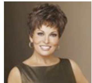
Peru Mono 619€ ***** 14 coloris