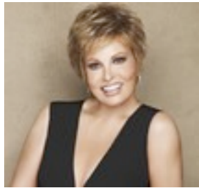
Boston Mono 589€ *** 13 coloris