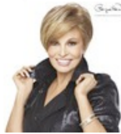
River Mono 389€ *** 14 coloris