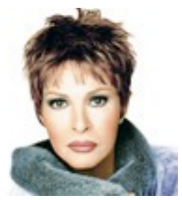
Lima Mono 569€ **** 14 coloris