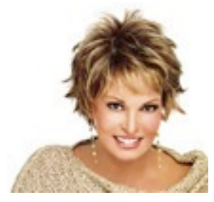
Aspen 289€ ** 14 coloris Aspen Mono 599€ **** 9 coloris