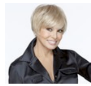
Detroit Mono 619€ **** 11 coloris