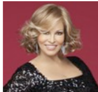
Cleveland Luxe 699€ ***** 9 coloris