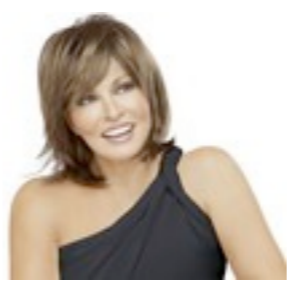
Fontana Mono 689€ **** 9 coloris