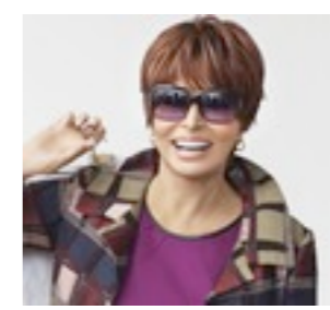
Panama 289€ ** 12 coloris Panama Mono 619€ **** 13 coloris