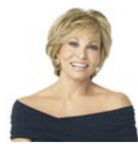
Virginia Luxe 699€ **** 12 coloris