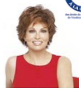
West 259€ ** 11 coloris