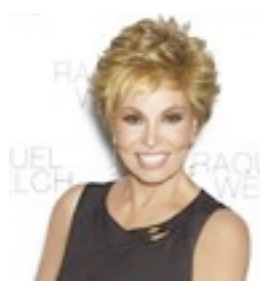
New York Mono 619€ **** 12 coloris