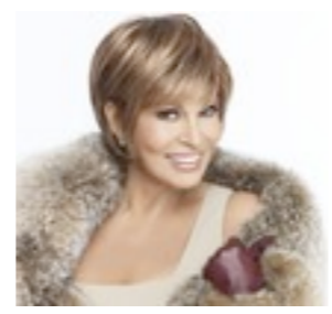
Cape Mono 419€ Cape Luxe 699€ **** 10 coloris