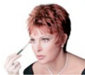
Alaska 349€ ** 14 coloris Alaska Mono 599€ **** 13 coloris