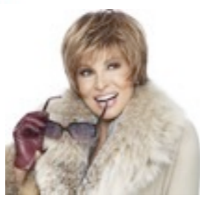
Cape Mono 419€ **** 11 coloris