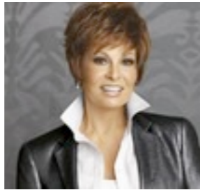
Memphis Luxe 759€ ***** 11 coloris