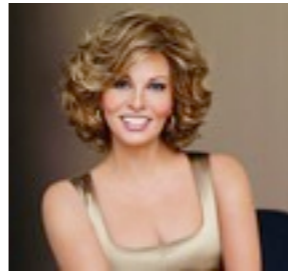
Empire Mono 619€ ***^ 9 coloris