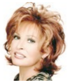
Dallas Mono 589€ **** 7 coloris