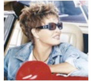
Rio 289€ ** 12 coloris