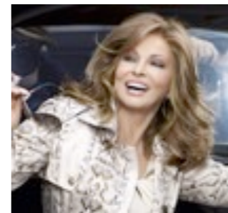
L.A. Mono 399€ ***^ 10 coloris