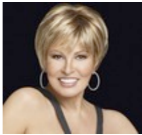
Nebraska Mono 629€ ***** 15 coloris