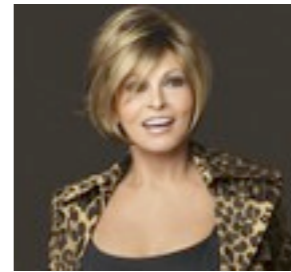
Lancaster Mono 629€ ***** 11 coloris