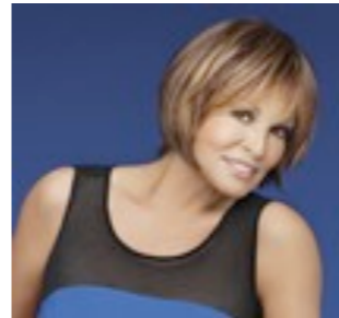
East Luxe 699€ ***** 9 coloris