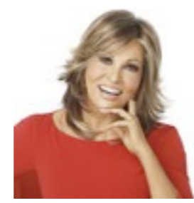
Atlantic Mono 359€ **** 8 coloris