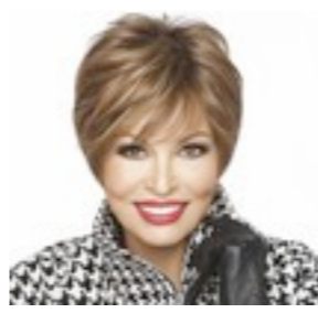
Richmond Mono 619€ **** 14 coloris