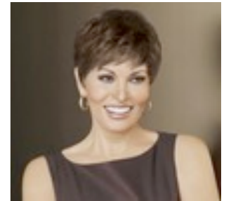
Peru 329€ **^ 14 coloris