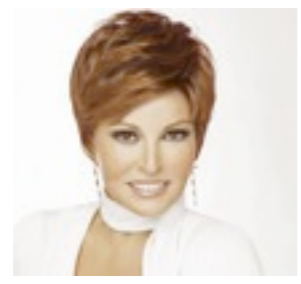
Island Mono 469€ **** 13 coloris