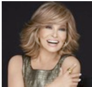
Broadway Luxe 699€ ***** 13 coloris